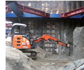
コンクリートの取壊し作業 ヤード内騒音、振動値表示