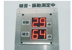
ヤード外地元住民公表用騒音、振動値表示